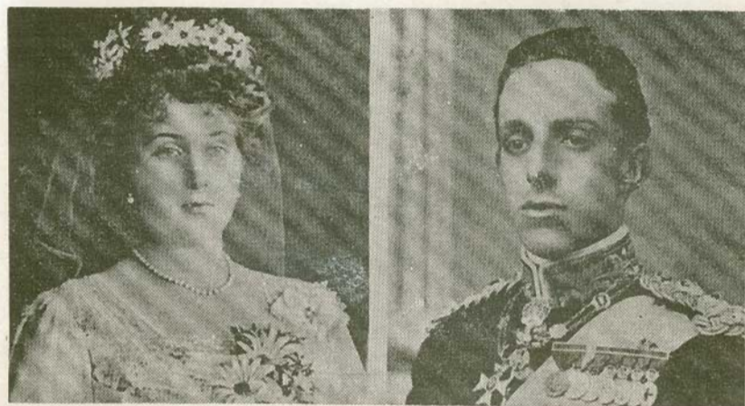
La reina Victoria y el rey Alfonso XIII,

Páginas Ilustradas en la humilde esfera en que le es posible moverse, se asocia á aquella publicidad, y por los modestos medios que están á su alcance, dedica hoy, casi por entero, su número á un suceso que, aunque afortunadamente fracasado, demuestra que el anarquismo de acción no desiste en su lucha declarada á la actual sociedad.