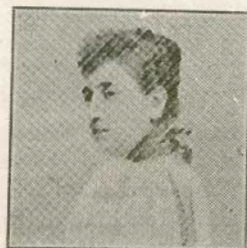
La marquesa de Tolosa muerta por la explosión

acuerdo colectivo, la sana razón se rebela contra un hecho que dirigido contra el jefe de una nación, deja indemne á éste y sacrifica en cambio á 23 inocentes, pues ese número es de los que murieron á causa de la explosión, la que hirió también, más ó menos gravemente, á 100 personas.