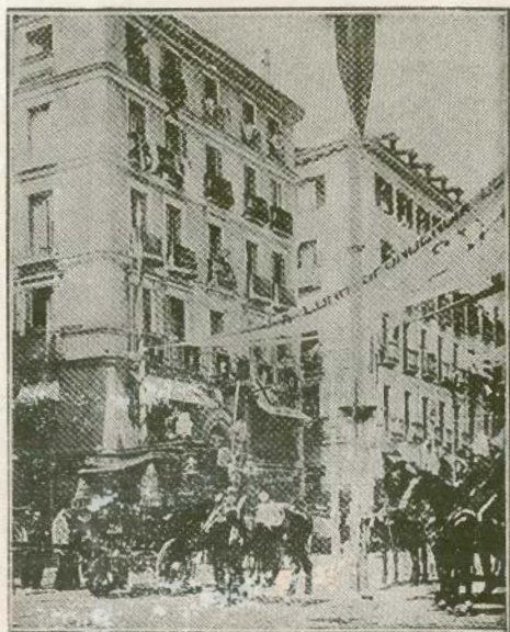
La casa de la Calle Mayor y la carroza real. El balcón marcado con una X es el lugar desde el cual el anarquista Morral arrojó la bomba

Santiago Salvador en el Liceo de Barcelona el 1º de noviembre del mismo año, 1894; los incógnitos autores de la bomba arrojada en la Calle de Cambios Nuevos el 10 de junio de 1896, al retirarse á la iglesia la procesión de Corpus: la desconocida fiera que el 17 de noviembre de 1904 sacrificaba á 21 personas en la Calle de Fernando: el no habido autor de la explosión ocurrida en la Rambla de las flores el 4 de setiembre de 1905, amen de otras y otras que por fortuna no llegaron á estallar, también colocadas en sitios públicos, con apellidarse anarquistas, tienen, sin duda, un valor moral infinitamente inferior que el de Pallás, Santos Caserio, Angiolillo y cuantos, como ellos, dirigieron su acción contra persona ó entidad determinada, llevados por el odio contra lo que á sus ojos representaba la ley, la autoridad ó el gobierno.