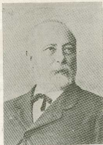
Don José Nakens,

que ocultó en la redacción de El Motín y proporcionó la fuga al anarquista Morral después de cometido el atentado y autor de la carta que reproducimos en otro lugar del presente número