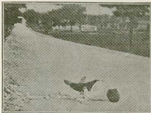
Posición en que se encontró el cadáver del guarda en la carretera de Loeches

Guarda asesinado por Morral antes de suicidarse