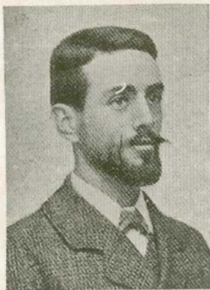
El anarquista Mateo Morral

Mateo Morral, joven también, pero agotado é incapaz ya de sentir los impulsos del santo sentimiento que une al hombre con la mujer, se llevó á la tumba, al romper de un balazo su vida, el verdadero móvil de su crimen y posiblemente el secreto de la complicidad, temiendo tal vez no poder resistir las pruebas de un interrogatorio.