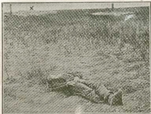
Posición en que fue encontrado el cadáver de Morral. En el lugar marcado con una X se encontró el cadáver del guarda

pudo burlar la acción de la justicia y escapar, siquiera transitoriamente, á la persecución. Una carta de don José Nakens, director de «El Motín», periódico anticlerical y revolucionario, que se publica en Madrid, vino á esclarecer aquellas nebulosidades y á explicar cómo pudo Morral sustraerse durante largas horas á las investigaciones policíacas.